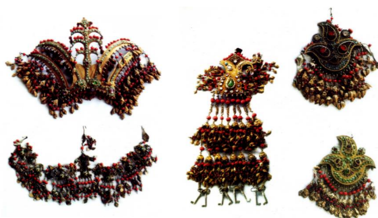
Хорезмские женские украшения. Хива. XIX век