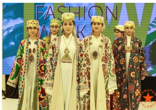
Кашкадарьинско - Сурхондарьинские костюмы