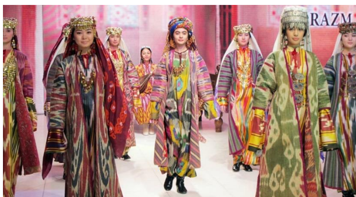
Хорезмские национальные костюмы

В 19 веке изготавливались украшения из золота и серебра, которые представляли собой драгоценные камни: бриллианты, рубины, изумруды, жемчуг, янтарь, рубины, бирюзу, горный хрусталь, жемчуг, оникс, хризолит, прозрачные и блестящие и украшенные узорчатыми камнями. Художественные возможности мастеров-ювелиров в выборе декоративных материалов были гораздо шире. Их художественное изящество является свидетельством мастерства мастеров-ювелиров, а важность таких изделий высоко ценится.